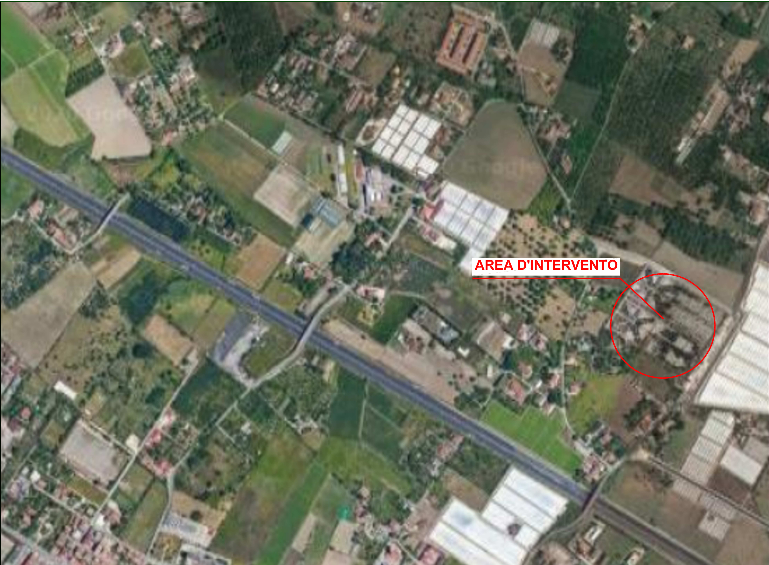
Ortofoto sc 1:5'000